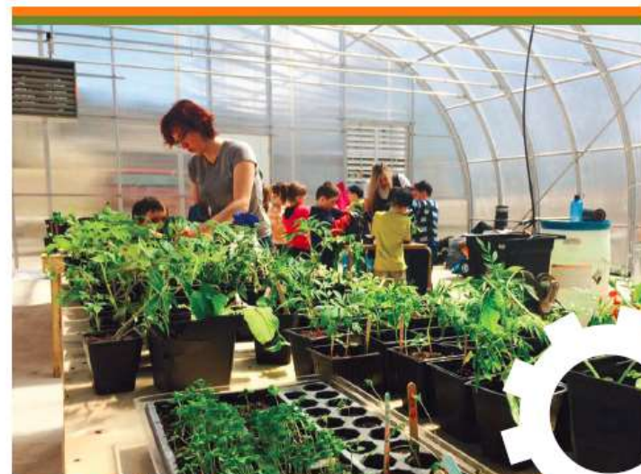
« Les Pouss d'Octave », École primaire Les Cheminots